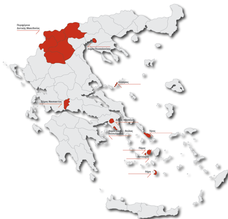
Εικόνα 1, Οι πιλοτικές περιοχές των δράσεων επίδειξης του LIFE-IP CEI-Greece | Δήμοι Αθήνας, Θεσ/κης, Αλοννήσου, Ναυπακτίας, Τήνου, Πάρου, Αντιπάρου, Θήρας, Βάρης-Βούλας-Βουλιαγμένης και Περιφέρεια Δυτικής Μακεδονίας.

εφοδιασμού τροφίμων από την αγροτική παραγωγή έως την τελική κατανάλωση, όπως σύστημα παρακολούθησης παραγωγής αποβλήτων τροφίμων, δράσεις επίδειξης βέλτιστων πρακτικών πρόληψης και ανάπτυξη πλατφόρμας για την παρακολούθηση και τη διαχείριση της πρόληψης παραγωγής αποβλήτων τροφίμων.