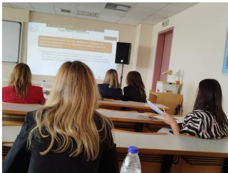
Εικόνα 1, Γενική άποψη της αίθουσας.

Με θέμα τη «Μέτρηση, πρόληψη και διαχείριση των αποβλήτων τροφίμων στον τομέα της εστίασης» , το 1ο Φόρουμ απευθύνθηκε στον τομέα της εστίασης και φιλοξενίας, καθώς στον τομέα αυτό υπάρχει μεγάλο περιθώριο εφαρμογής δράσεων πρόληψης με σημαντικό περιβαλλοντικό, οικονομικό και κοινωνικό όφελος, γι' αυτό και ο πρόσφατος νόμος 4819/2021 εισάγει σχετικές υποχρεώσεις αλλά και νέες δυνατότητες διαχείρισης και χρέωσης για τα απόβλητα αυτά.